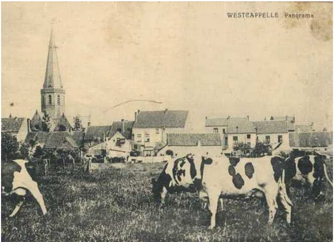
Westkapelle: panorama met de kerk, huizen en koeien; 1924 prentbriefkaart; uitgever: Missiaen-Stevens, Westkapelle; vervaardiger: PhoB