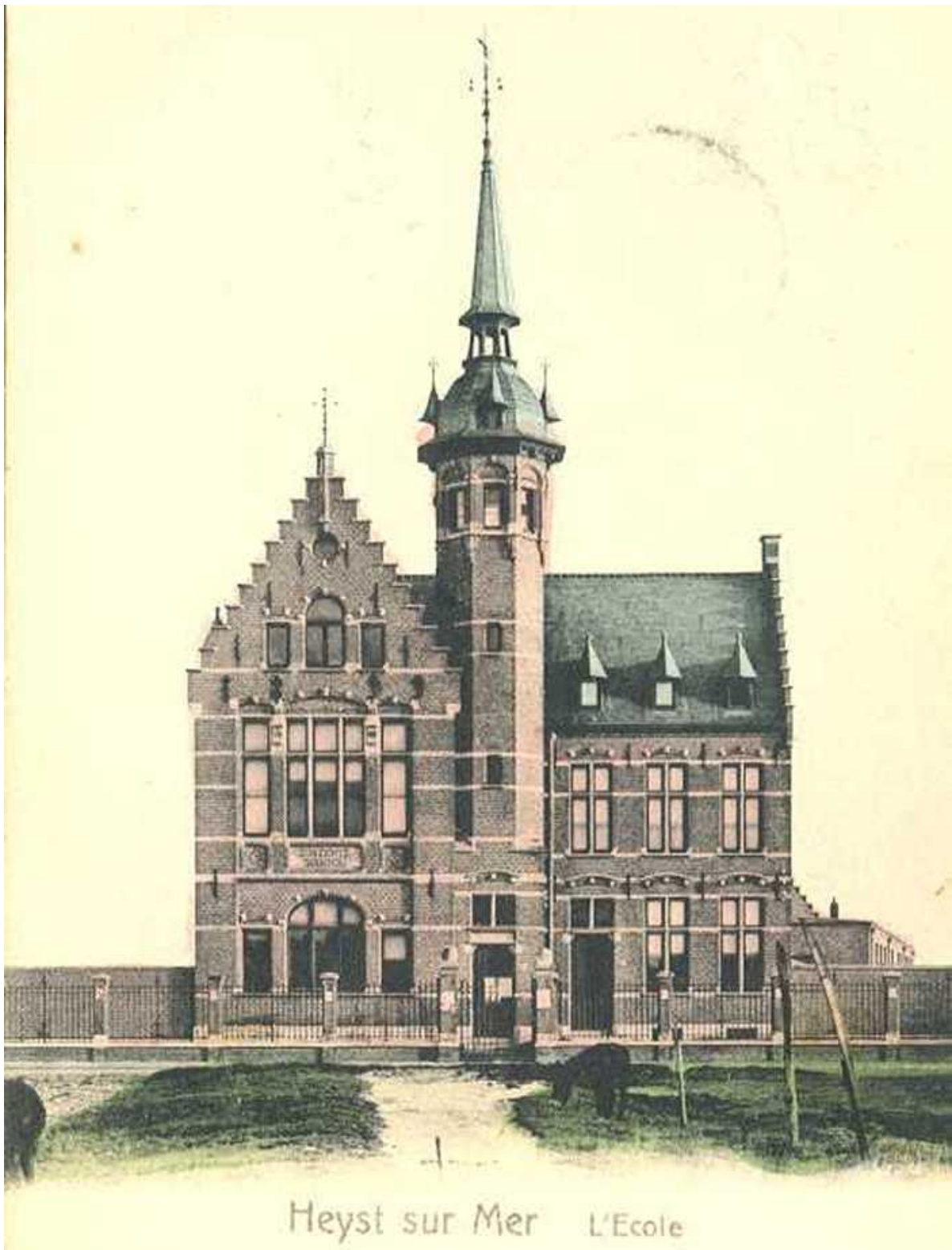
Gemeenteschool Heist, 1907, Pannenstraat, nu Museum Sincfala Prentbriefkaart, poststempel: 25/07/1907 Vervaardiger: Wilhelm Hoffmann, Dresden (D)