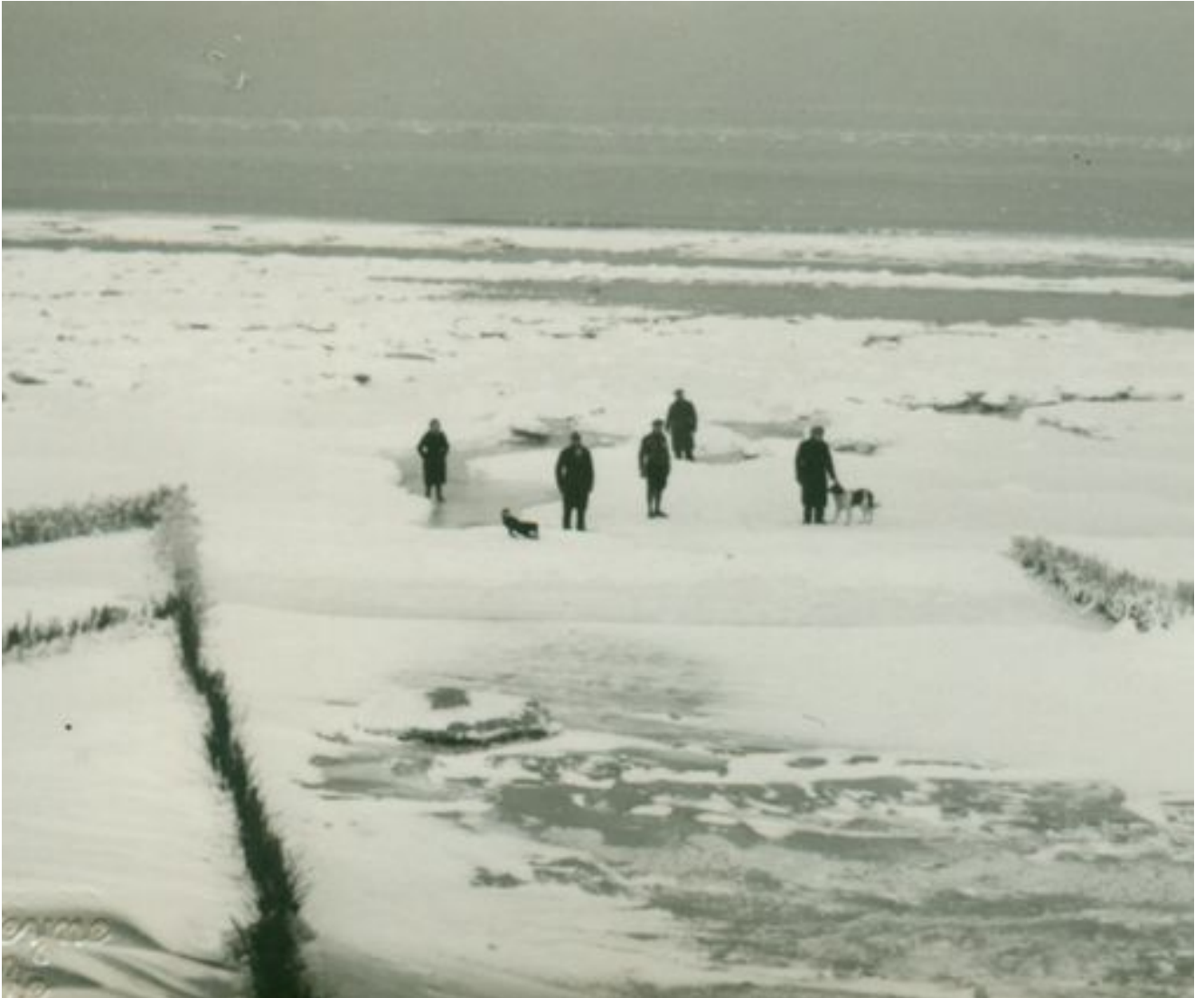
Strand van Knokke-Heist, toen de zee bevrozen was, 1963 Vervaardiger: Watteyne, A. (Knokke) © Museum Sinfala