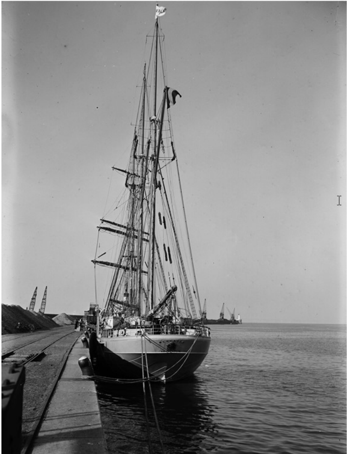
Zeilschip Mercator aangemeerd in de haven van Zeebrugge; op de achtergrond de havendam met vuurtoren, 1919

Vervaardiger: Brusselle A.; Collectie Stadsarchief Brugge / Brusselle-Traen © Erfgoed Brugge