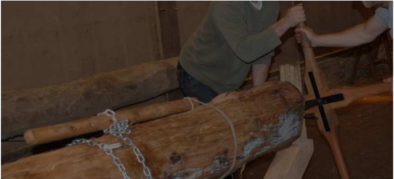
Pompboren: een stam wordt in de lengte uitgehold.

Het beroep van pompboorder is een beroep dat bijna helemaal uit ons collectieve geheugen is gewist.