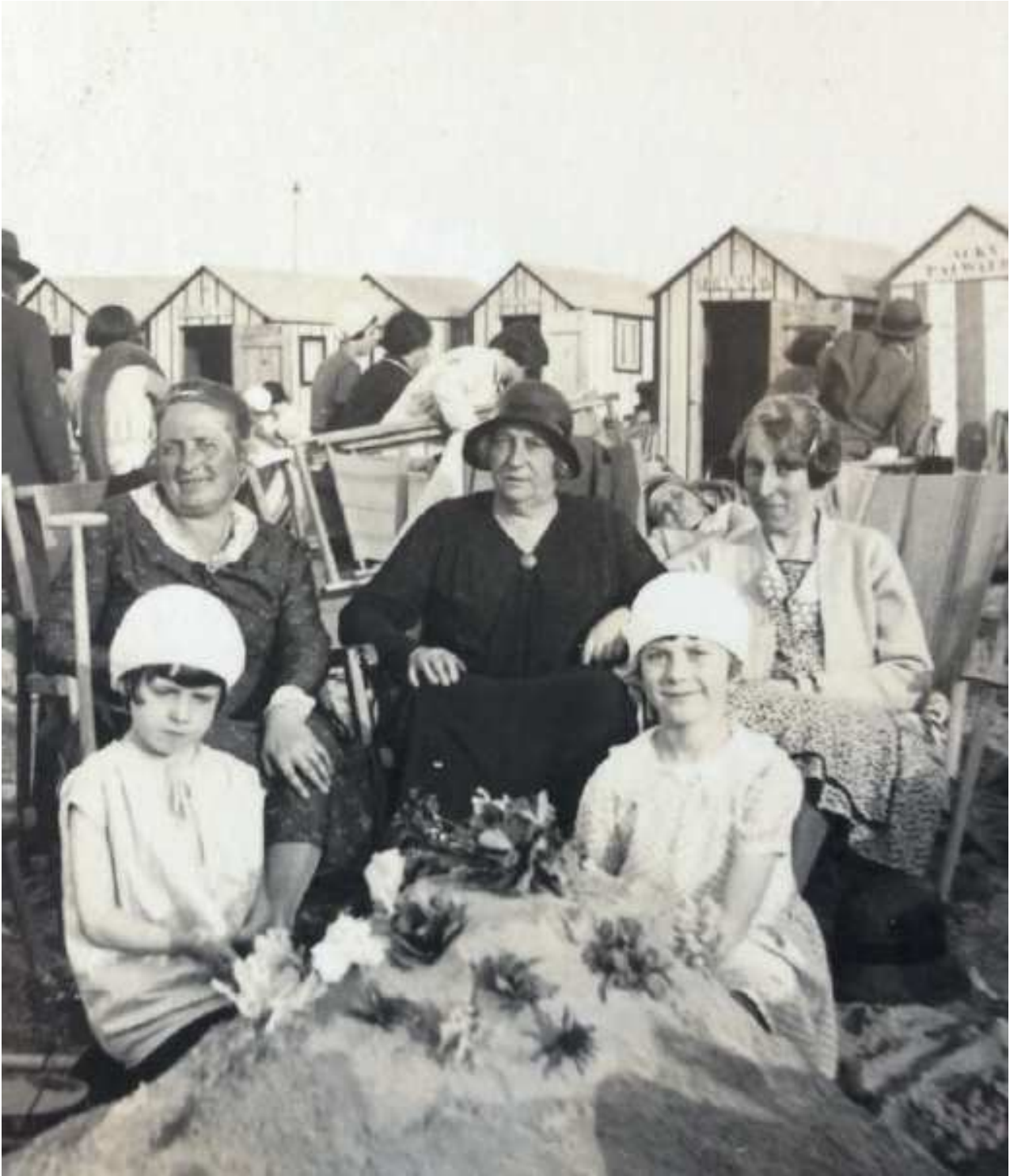
Strandbloemenkraampje in Heist, 1931 (uit: "Strand in bloei of hoe de strandbloemen groeien aan onze kust", Erfgoedcel Kustergoed, 2020; uitgave in het kader van het gelijknamige project over de strandbloementraditie aan de Belgische kust, p.2)