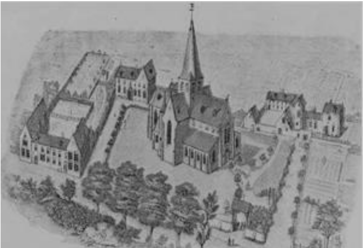
Het neogotisch complex van Vivenkapelle, vroeger.....