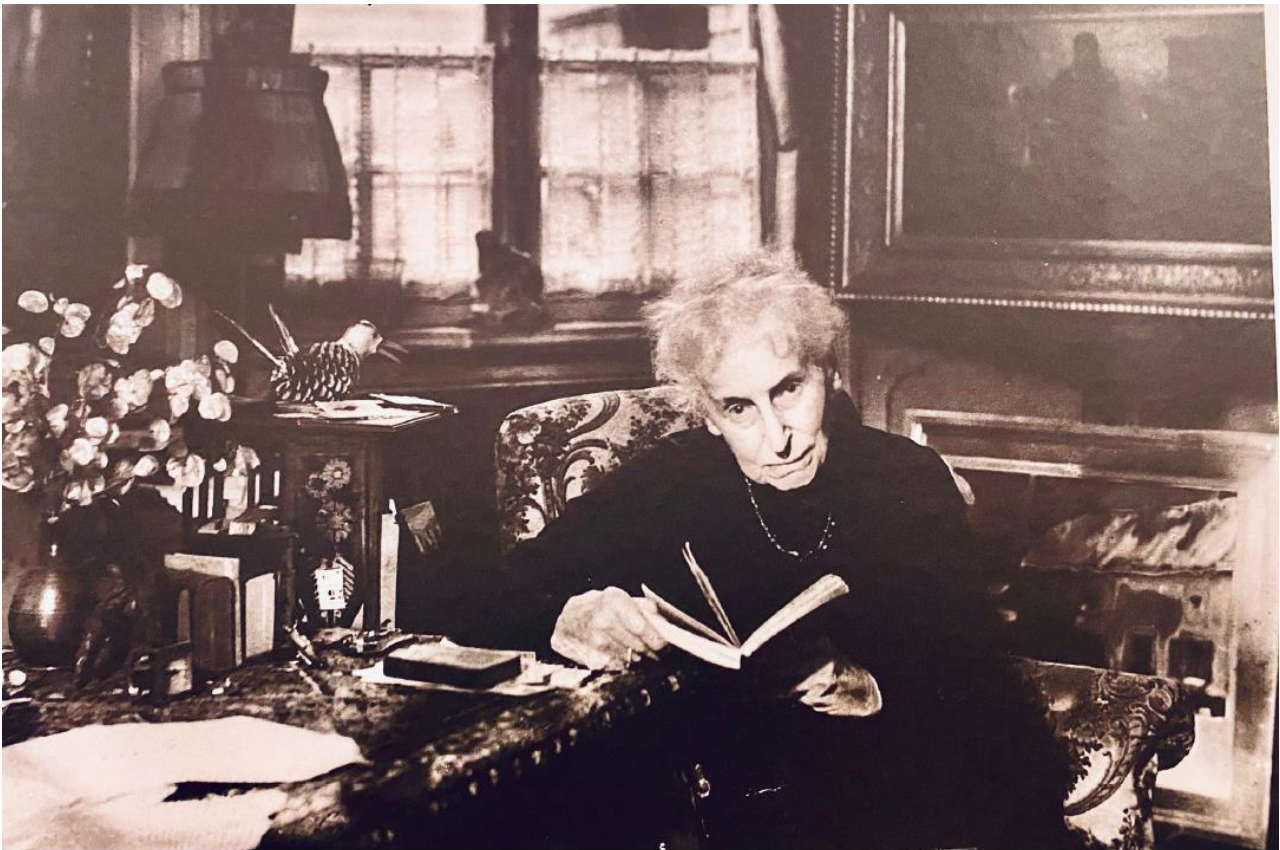
Anna in haar herenhuis in Elsene - La Villa Anna - dat dienstdeed als een ontmoetingsplaats voor kunstenaars.

Als impressionistische kunstenaar genoot Anna Boch internationale waardering. Rond 1900 was ze zelfs de meest prominente vrouwelijke kunstenaar in België. Precies deze periode van het fin de siècle en de belle époque vormt het chronologische beginpunt van de focus van Mu.ZEE.