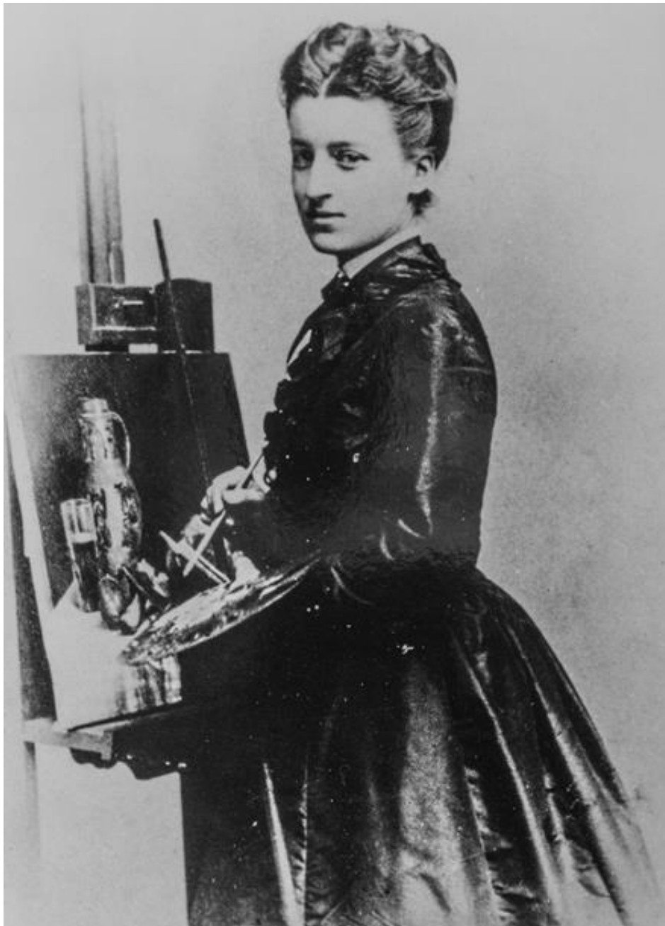
Portretfoto van Anna Boch bij schildersezal Privécollectie, Binche. Foto Vincent Everarts